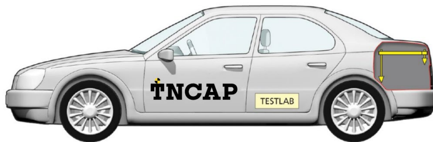
圖1：設置座標軸參考框架